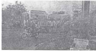
Bloqueos en el barrio Las Mercedes.